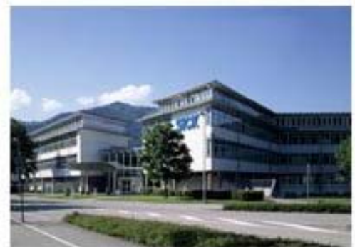
SICK AG, Waldkirch